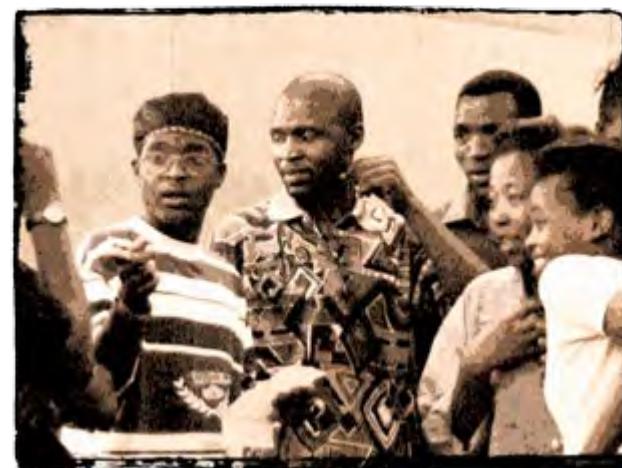
Der Phikelela Sakhula Chor aus Südafrika

Er ist in einem Zeitraum von zwanzig Jahre ab und zu in Afrika umhergeschweift, hat dabei mit vielen Sängerinnen, Sängern und Musikern aus verschiedenen Ländern gearbeitet. Das alles hat er in seinen verschiedenen Projek-