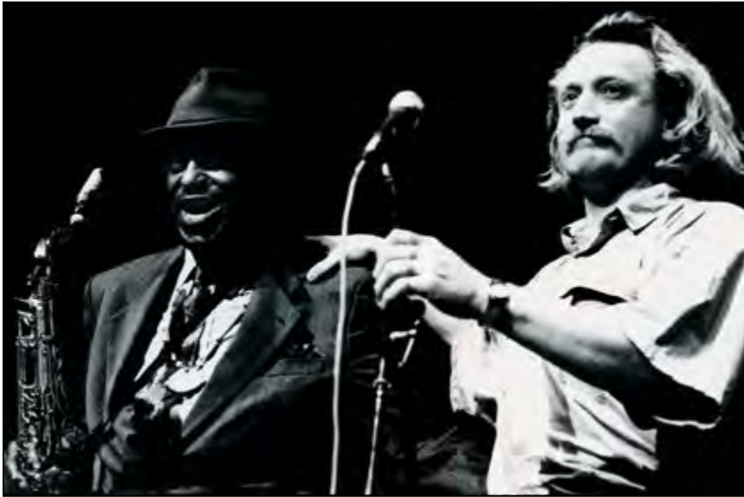
Archie Shepp und Jasper van't Hof