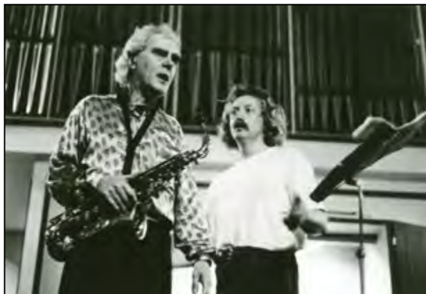
Charlie Mariano und Jasper van't Hof

Pianist/Komponist in Europa erworben hat. Sein Können, mit Kollegen in immer wechselnden Zusammenstellungen zusammenzuarbeiten, hat er zur Kunst erhoben. Auch der vermeintliche Mangel an Anerkennung war ein »non-issue«, letztendlich hat er selber ein Abenteuer außerhalb der Landesgrenzen gewählt. Es sind Themen, die in dieser Biografie mal mehr, mal weniger berührt werden. Aber weil es die Pfeiler seiner Existenz als Musiker und Komponist sind, gehe ich in diesem letzten Kapitel stärker darauf ein.