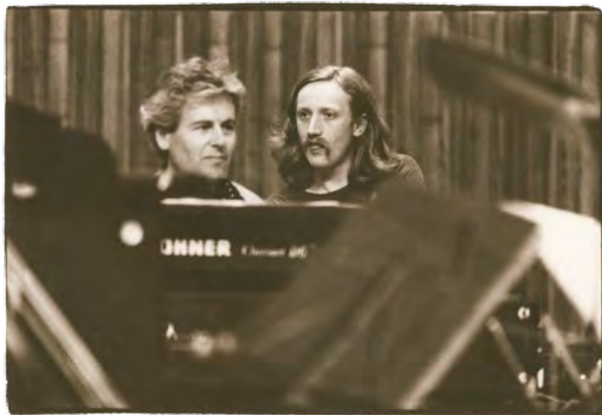
George Gruntz und Jasper