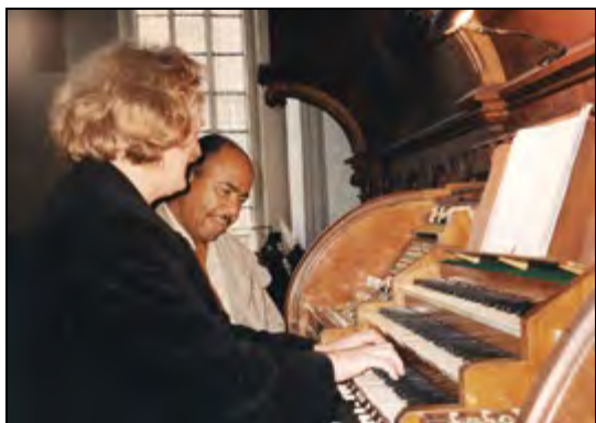
Met Benny Golson en Gedächtniskirche, Berlin