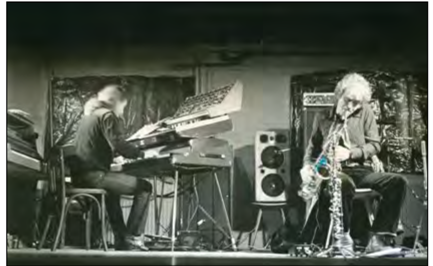
Jasper van't Hof en Charlie Mariano

twee jaar dat ze samen als Pork Pie speelden maakten ze twee lp's: Transitory (1974) en The Door is Open (1976). De band zou in 1992 nog een keer samen komen voor de opname van de lp Operanoia in de samenstelling: Philip Catherine (gitaar), Don Alias (drums), Charlie Mariano (sax) en Jasper van 't Hof (piano).